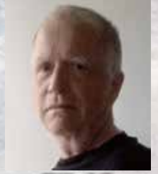
装置・衣裳 ヘニング・フォン・ギールケ