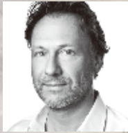
オランダ人 ロバート・ボーク