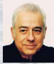
演出 ミヒヤエル・ハンペ