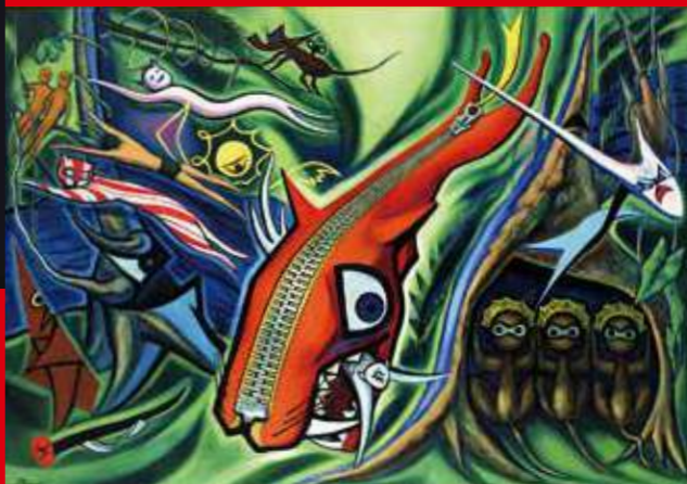
岡本太郎(森の廻り)1950年