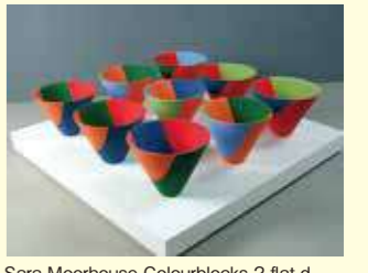
Sara Moorhouse Colourblocks 2 flat d