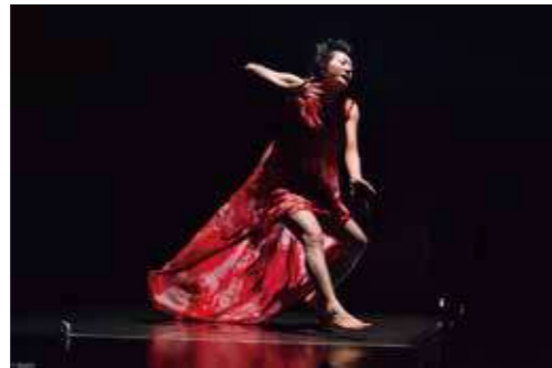
森下真樹 撮影 bozzo