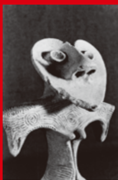
土偶 (群馬県出土) 1956年 (東京国立博物館)

「岡本太郎の土偶の写真からは、それぞれの土偶に宿る縄文人の生命力や神秘性が強く感じられます。しかし、実物の土偶たちは穏やかな顔で静かに沈黙し続けています。私はこの二面性を大切にしたいと思っています。それこそが岡本の言う『対極』(※註2)に位置づけられる感性ではないかと思っています。」