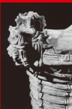
岡本太郎撮影 縄文土器 (富山県出土) 1956年 (東京大学人類学教室)

「縄文土器に斜めから強い光を当て、被写体の陰影を際立たせる岡本太郎の縄文土器の写真。そこにはまさに谷崎潤一郎の『陰翳礼賛』の世界と重なるところがありません。『生活と自然が一体化し、真に風雅の骨髄を知っていた日本人の芸術的な感性』を表現しようとしたのか。縄文土器の全体像もさることながら、縄文土器の個性を際立たせる土器の把手や隆起した渦巻文様に焦点を当てた岡本独自の視点でとらえた縄文土器の写真の数々。