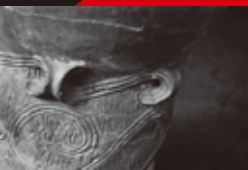
岡本太郎撮影 縄文土器 (東京都あきる野市出土) 1956年 (東京国立博物館)

「今回の展覧会では、全体を『自己をみつめる太郎』『日本をみつめる太郎』として、『世界をみつめる太郎』の3章に分け、制作文筆、撮影といっ