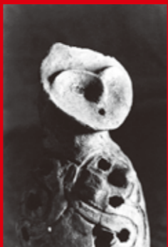
土偶 (神奈川県横浜市出土) 1956年 (東京国立博物館)