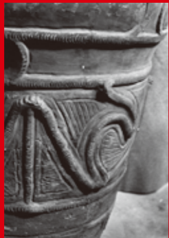
岡本太郎撮影 縄文土器 (東京都あきる野市出土) 1956年 (東京国立博物館)

たマルチな活動から革命的なビジョンを鮮やかに展開させていった岡本太郎に迫ります。