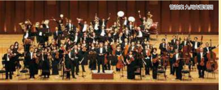
管弦楽九州交響楽団

【時間】開場13:30、開演14:00 【料金】【全指定席】S席3,000円、A席2,000円、びびり割/各10%割引、U25割/各半額(びびり割併用不可) 【出演】指揮：茂木大輔、管弦楽：九州交響楽団、司会進行：児玉けんめい