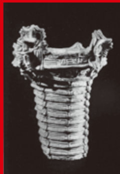
岡本太郎撮影 縄文土器 (富山県出土) 1956年 (東京大学人類学教室) ( )内は当時の撮影地

「縄文展では岡本太郎が実際に撮影した縄文土器が並びました。写真と実物を比較して、どのような点が、岡本太郎独自の視点で反映しているといえるでしょうか？」