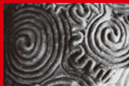
岡本太郎撮影 縄文土器 文様 (富山県出土) 1956年