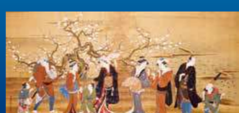
歌川豊春(観梅図)江戸時代 大分県立美術館 全期間展示