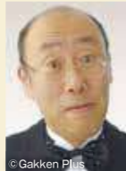
青島広志 (お話し: ピアノ)

テレビでもおなじみの青島広志先生が、3年ぶりに大分へ! 10月24日上演のオペラ『トゥーランドット』の見どころ・聴きどころを、3人の歌手を交えて解説する、楽しく学べるコンサートです。