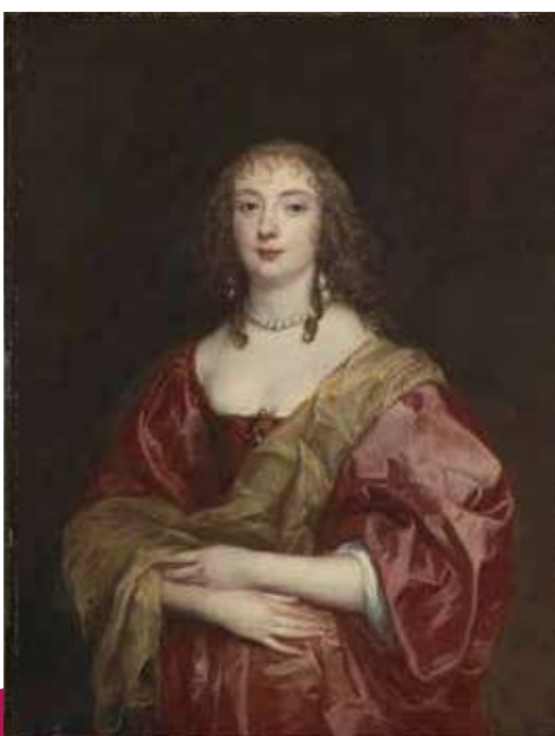
アントニー・ヴァン・ダイク 《ベッドフォード伯爵夫人 アン・カーの肖像》1639年