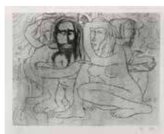
高山辰雄《聖家族その10》1976年

OPAMコレクションの中から、「天国と地獄」をイメージさせる作品を紹介します。映画やオペレッタにも同名のタイトルのものがありますが、さて、OPAMの「天国と地獄」とは?この夏、OPAMで体験してみる?!