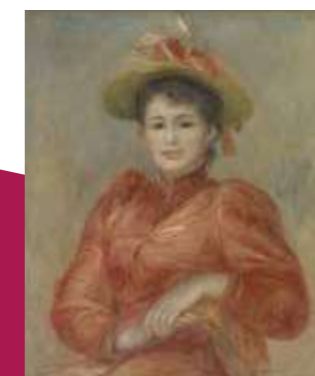
ピエール＝オーギュスト・ルノワール 《赤い服の女》1892年頃

作品全て 東京富士美術館所蔵