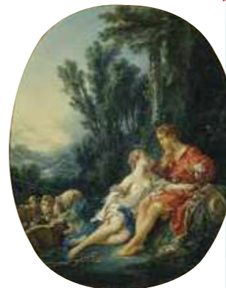
フランソワ・ブーシェ 《田園の奏楽》1743年