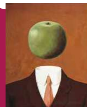
ルネ・マグリット 《観念》1966年