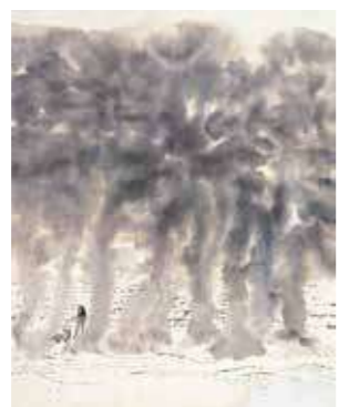
高山辰雄《春日浦風景・思い出》制作年不詳