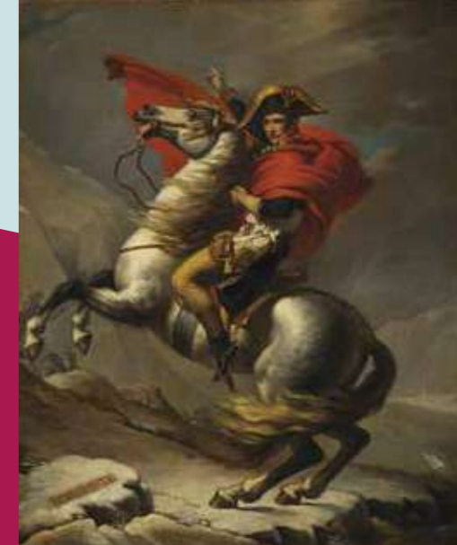
ジャック＝ルイ・ダヴィッドの工房 《サン＝ベルナル峠を越えるポナパルト》1805年