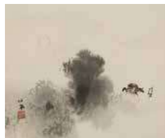
竹内栖鳳《山村月夕》昭和初期頃(前期のみ)