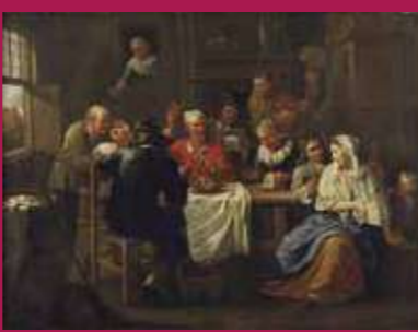
ピエール・ベルゲニュー 《田園の奏楽》17世紀後半-18世紀初頭