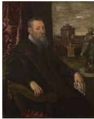
ヤコボ・ティントレット 《蒐集家の肖像》1560-65年