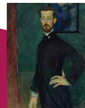
アメデオ・モディリアーニ 《ポール・アレクサンドル博士》1909年