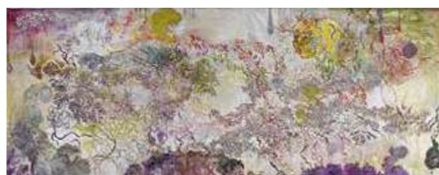
真島直子《脳内麻薬4》 2015年(寄託品)