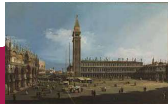
カナレット (ジョヴァンニ・アントニオ・カナレ) 《ヴェネツィア、サンマルコ広場》1732-33年