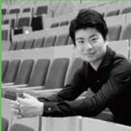
水谷 晃 ヴァイオリン

大分市出身。中島小学校在学中に父の転勤で5年間インドネシアへ。桐朋学園大学を首席で卒業。ウェールズ弦楽四重奏団初期メンバーとして在学中にミュンヘン国際音楽コンクールで第3位入賞。2010年4月より群馬交響楽団コンサートマスター（当時国内最年少）に就任。現在は、東京交響楽団コンサートマスター、オーケストラ・アンサンブル金沢客員コンサートマスターのほか、桐朋学園大学等で後進の指導にあたる。