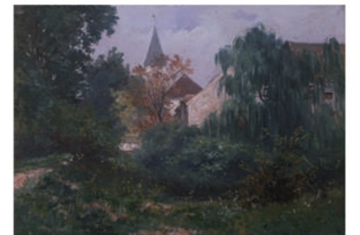
藤雅三《フランス風景》1887年 東京国立博物館 所蔵

白杵出身の藤雅三は、1885年にフランスに渡り、現地の洋画に接します。同じ頃、法律を学びにパリにいた黒田清輝に藤が通訳を依頼したことをきっかけに、黒田は絵画に目覚めます。黒田は、日本の「近代洋画の父」とされる人物ですが、黒田を洋画へと導いた藤の存在は大きかったといえるでしょう。本展では、 日本に1点しかない藤の油彩画 をご紹介します。