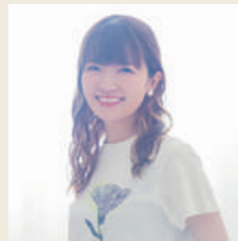
種崎敦美(声優) 大分県出身