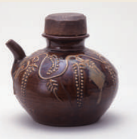
小鹿田焼 鉛釉筒描き藤文口付徳利

1995年、小鹿田焼の技法が重要無形文化財に指定されました。今年で30年を迎えます。小鹿田焼は、日田市の皿山の土で作られています。地域的特色のある工芸品です。制作にも伝統的な用具が用いられます。特徴は、素朴であたたかみのある質感です。さらにこの作品では、丸みを帯びた形と藤の花の飾りが魅力になっています。