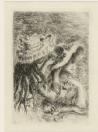
オーギュスト・ルノワール 《花飾りのついた帽子》1894年

ルノワール(1841-1919年)の希少な版画を初公開します。ルノワールは、《花飾りのついた帽子》という題名で、同じ構図の3つのエッチングと3つのリトグラフを作りました。この作品は、エッチングの第3版にあたります。画中にはルノワールのお気に入りのモデルが描かれています。マネの姪です。花かざりのある大きな帽子をかぶっています。それをもう一人の少女が直しています。太陽の日差しと花が感じ取れるかのような光景です。