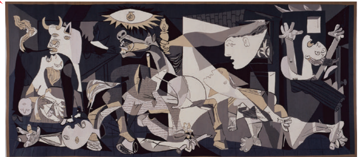
パブロ・ピカソ(原画)/ジャック・リヌ・ド・ラ・ボーム=デュバルバック(織)《ゲルニカ(タピスリ)》1983年(原画1937年)群馬県立近代美術館 所蔵 © 2024 - Succession Pablo Picasso - BCF (JAPAN)

パブロ・ピカソの《ゲルニカ》(1937年)はスペイン内戦時に無差別爆撃を受けた都市名をタイトルに、平和の尊さを語り続ける名作です。生前のピカソがその普及を目的に3点のみ作ることを条件とした、 ほぼ原寸大の《ゲルニカ(タピスリ)》 を展示します。タピスリを通して《ゲルニカ》の日本への影響を紐解くとともに、大分県出身の画家・佐藤敬が《ゲルニカ》に反応して描いた大作をご紹介します。