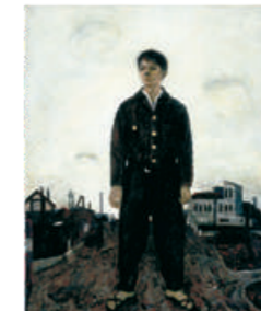
松本俊介《立てる像》1942年 神奈川県立近代美術館 所蔵