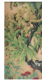
福田平八郎《安石榴》1920年 大分県立美術館 所蔵

夏に開催された「没後50年福田平八郎」を楽しまれた方も多いのではないでしょうか。本展では大正期の京都画壇と福田の関係を掘り下げます。若き日の福田に大きな影響を与えた土田麦穂、榊原紫峰らにはじまり、福田と親しい友人であった岡本神草にみる「デロリの美」など、福田がその才能を開花させた時代の空気を感じていただくチャンスです。