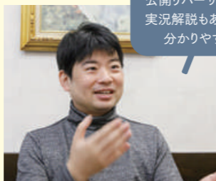
公開リハーサルでは 実況解説もあるから 分かりやすい