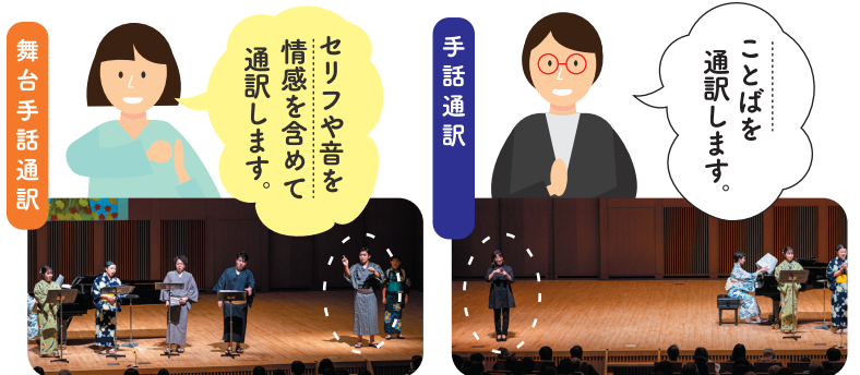
舞台手話通訳 / 福岡ろう劇団博多

舞台から発信される「音の情報」を手話で伝える通訳です。歌詞の内容だけでなく、リズムや抑揚も含めた舞台全体の雰囲気を表現します。