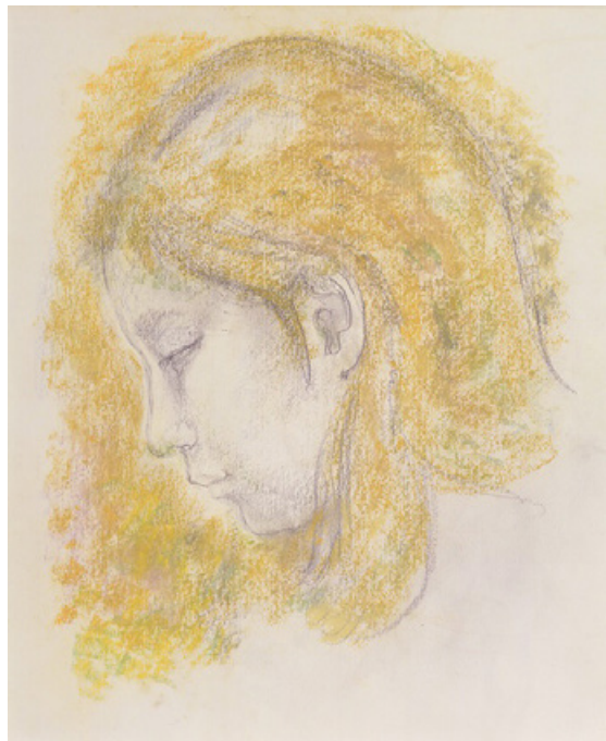
▲高山辰雄《少女》1978年頃