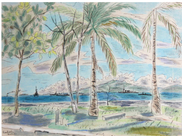
▲佐藤敬《マニラ風景》1942年