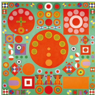
▲宇治山哲平《華巖 No.5》1978年